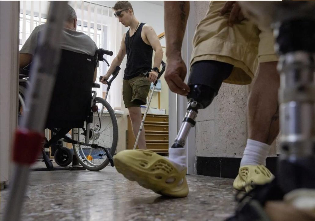
10r Zobbiv was wounded in March.